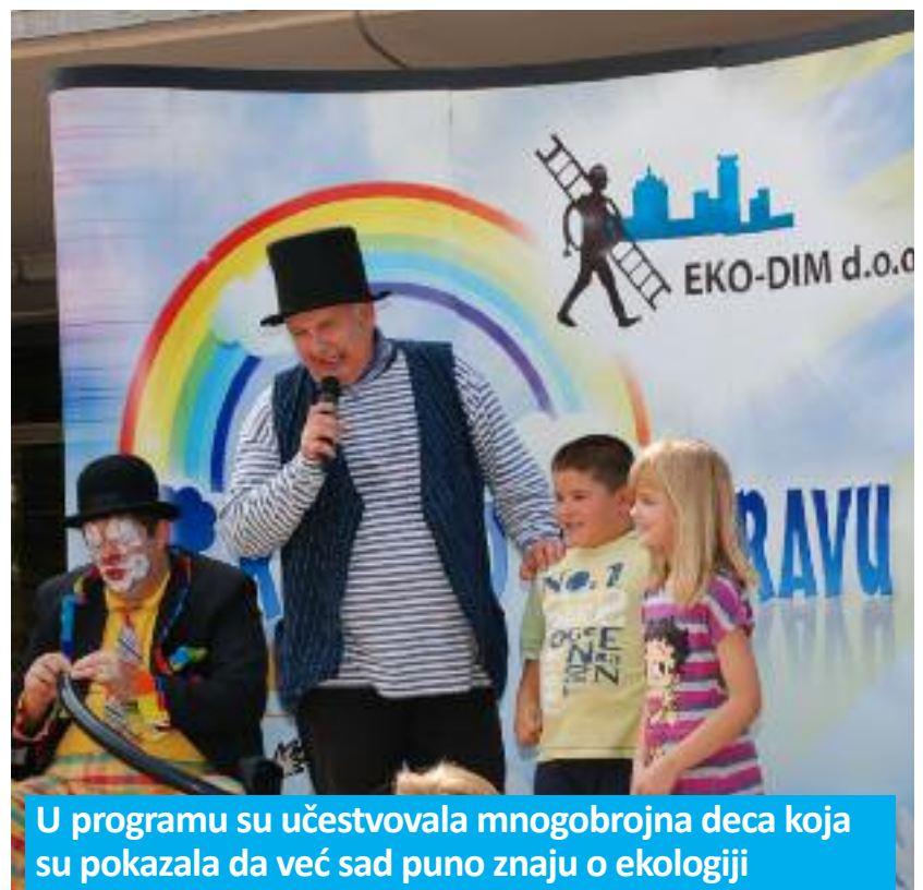
U programu su učestvovala mnogobrojna deca koja su pokazala da već sad puno znaju o ekologiji