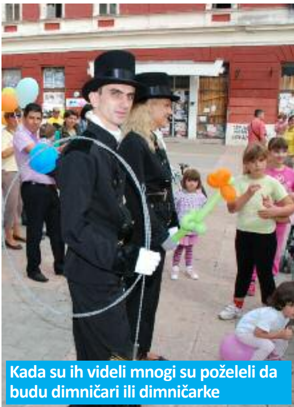
Kada su ih videli mnogi su poželeli da budu dimničari ili dimničarke