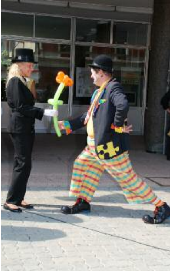
Klovn Pera je pokušao da šarmira našu dimničarku cvetom od balona